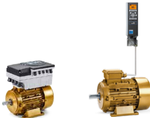
Selbstgekühlter IP55 Frequenzumrichter, geeignet für Motormontage