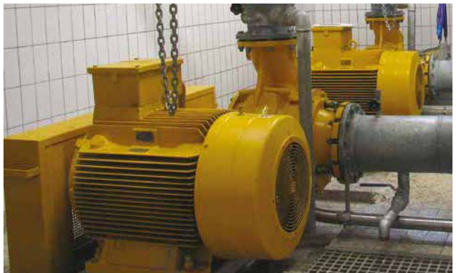
Gerade bei Abwasserpumpen kommt es häufiger zur Verstopfung. Der Rückspülmodus des VLT® AQUA Drive sorgt für einen wirkungsvollen Schutz.

Wartungskosten durch regelmäßiges Rückspülen. Diese Funktion erhöht die Lebenszeit und Effizienz der Pumpe.