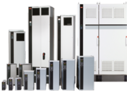
Der Rückspülmodus ist speziell für die VLT® AQUA Drive-Familie entwickelt worden.

Abwasser aus Haushalten und Industriebetrieben enthält Partikel und Fasern, die Filter nicht vollständig ausfiltern können. Diese Teile lagern sich auf den Flügelrädern ab, was zu einer Leistungsminderung und übermäßigem Verschleiß bei Pumpen führt. Die Wartung verstopfter Pumpen kann viel Zeit in Anspruch nehmen und ist sehr kostenintensiv: von der Anfahrt zum Standort und dem Heben der Pumpe über die Reinigung bis zum Wiedereinbau. Darüber hinaus ist häufig eine spezielle Ausrüstung erforderlich.